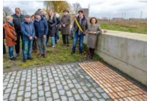
© Inhoudiging te mercatoereiland, 2023 Foto: Clara Spilliaert