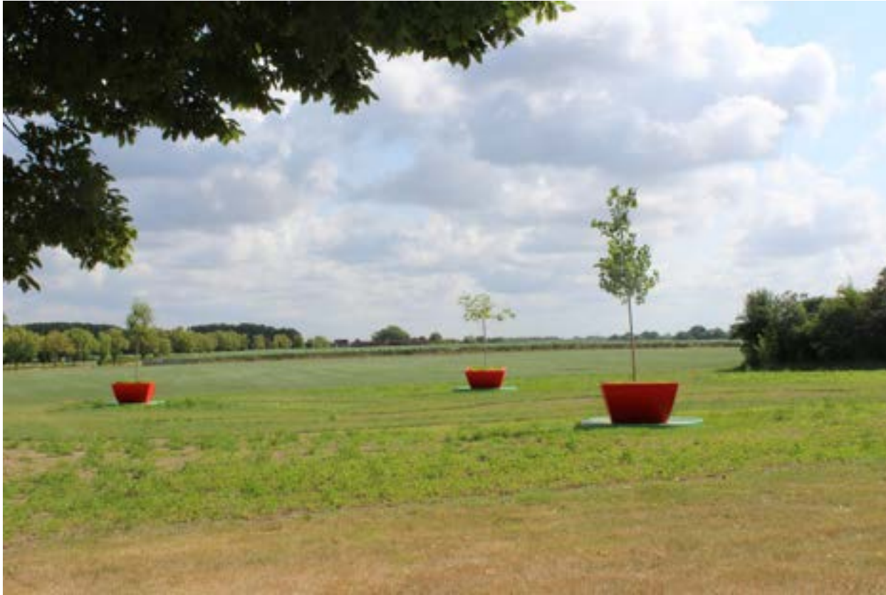
© 'Egularbre' door kunstenaarsduo Driessens en Verstappen, 2023. Foto Uitvoering: Ilvo