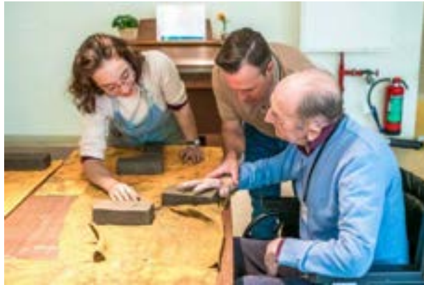
© Workshop woonzorgcentrum, 2023 Foto: Clara Spilliaert