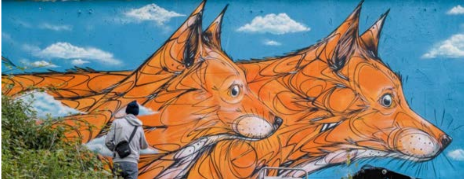
© Graffiti tekening vos op de animalinas-route, Straatkunstenaar Dzia. (2021).