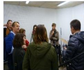
Visita de tècnics de joventut de Flandes a l'Estació Jove