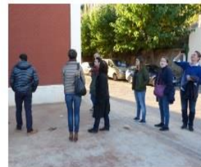
Visita de tècnics de joventut de Flandes a l'Estació Jove