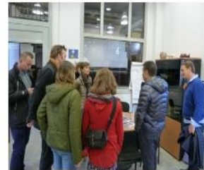
Visita de tècnics de joventut de Flandes a l'Estació Jove